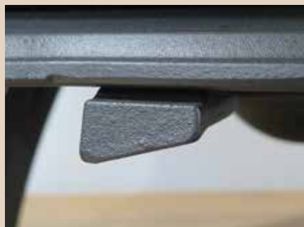
Manette unique de réglages d'air de combustion

Un poêle à bois au design classique avec porte latérale de chargement.