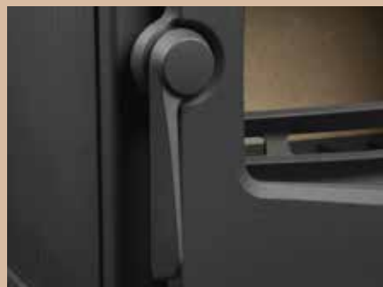
Poignée de porte en fonte