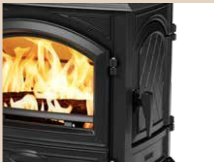
Porte latérale de chargement