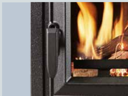
Poignée de porte